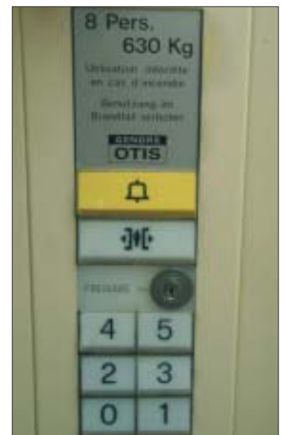
Was tun, wenn der «Fahrstuhl» nach oben besetzt ist?