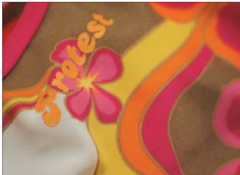
PROTEST im Stil des «Flower-Power». Die 68-er-Bewegung war geprägt vom Wunsch nach Veränderung der Welt, nach Frieden und Gerechtigkeit.

sondern wir selber, ich persönlich gefordert gewesen war bzw. immer noch bin. Zivilcourage heisst, dass ich mich nicht hinter etwas oder jemandem verstecke, sondern selber auftrete. Wir wissen nur zu gut: Dies ist keine Selbstverständlichkeit.