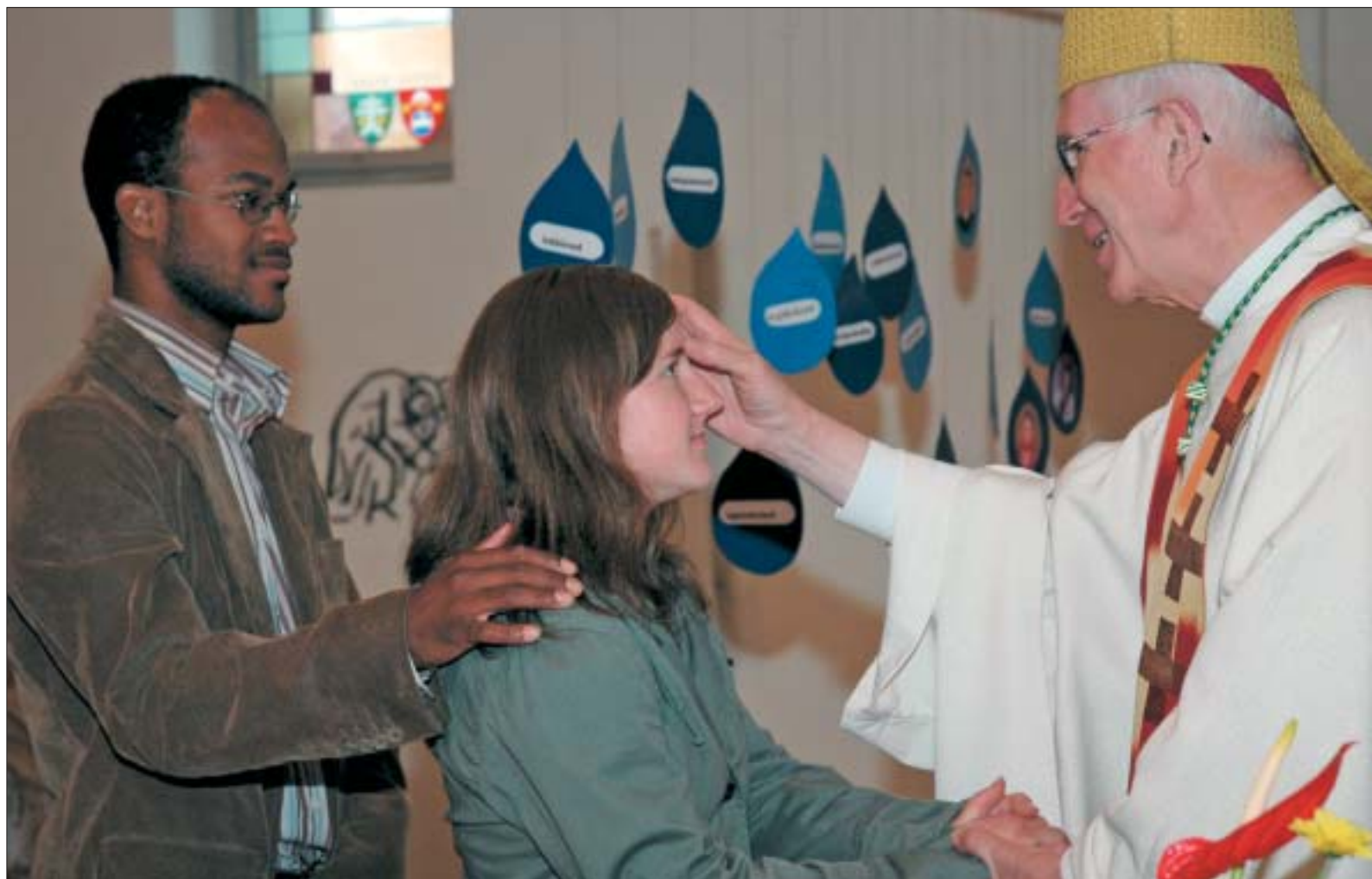
Wenn der Bischof junge Menschen – begleitet von ihren Paten – firmt, begegnen sich gegensätzliche Welten. Wie kann die Kirche der Herausforderung gerecht werden, ihnen eine Heimat zu bieten?