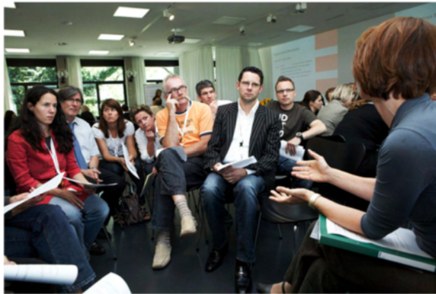
BZ4: Rahmenbedingungen der Berufsbildung