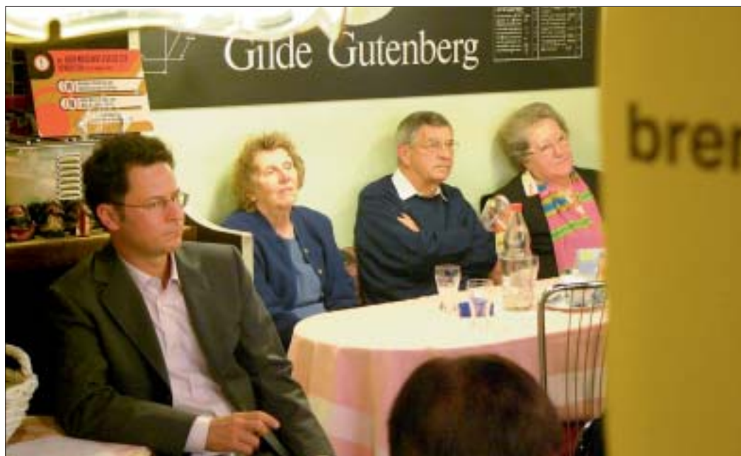
Brennpunkt-ZuhörerInnen im Café Baumgasse.