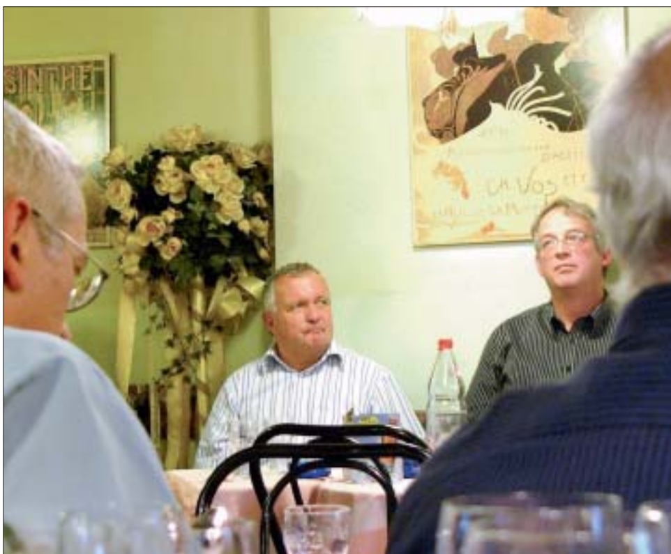
«Sozialethik-Café»-Gäste folgen gebannt den Ausführungen der Referenten.

Schips: Der Biobauer kann seine Tomaten auch nicht für 5 Franken pro Kilo anbieten, weil sie ihm so niemand abkauft.