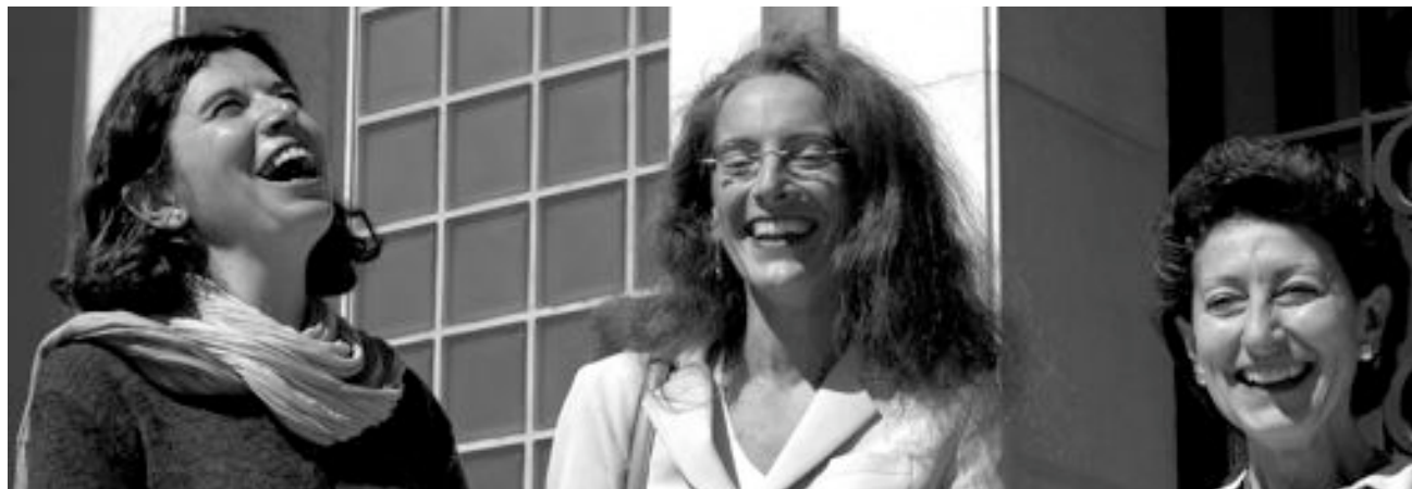
Einsatz für Rechte - mit Freude!

hat die Schweiz die Frauenrechts-Konvention ratifiziert. Erstmals 2001 lieferte sie dem CEDAW-Komitee einen Rechenschaftsbericht darüber, in welchen Bereichen Frauen in der Schweiz nach wie vor diskriminiert werden. Grosse Defizite wurden bei der Arbeit - zum Beispiel Lohndiskriminierung - sowie bei der höheren Bildung festgestellt.