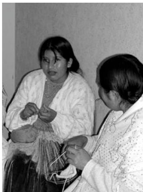
Auch Hausangestellte brauchen einen Ort, wo sie sich austauschen können

Dies sind minimale gesetzliche Forderungen, doch sie werden oft nicht beachtet. Hier setzt die Unterstützung des Elisabethenwerks in Zusammenarbeit mit der Vereinigung FENATRAHOB an. Die indianischen Mädchen, die in die Stadt kommen, sollen möglichst früh über ihre Rechte aufgeklärt werden. Sie sollen wissen, dass es einen Ort gibt, an dem sie sich mit Kolleginnen treffen, sich weiterbilden und eine Rechtsberatung aufsuchen können.