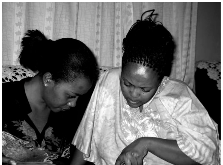
Frauen unterstützen Frauen

Ausserdem kann sie nach einem Training für die Sicherung von Beweisen bei Vergewaltigung und sexuelle Übergriffen tätig werden. „Heute wissen die Opfer, dass sie sich nicht duschen dürfen und sofort einen Arzt aufsuchen müssen. Ausserdem müssen sie Medikamente gegen sexuell übertragbare Krankheiten erhalten.“ Das Team sorgt auch dafür, dass gravierende Fälle in die Medien und die Verantwortlichen vor Gericht kommen.