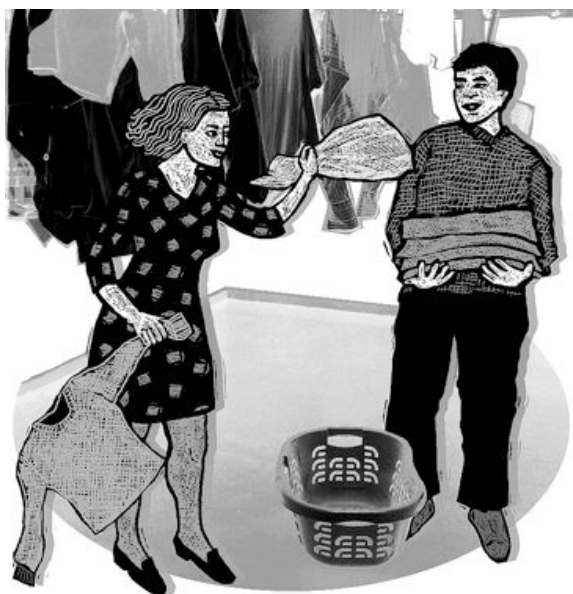
Illustration: Rebecca Hug

Trotz fehlender Kinderbetreuung, verzerrter Stundenpläne in der Schule, Benachteiligungen bei den Sozialversicherungen und durchschnitt-