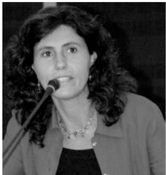
Frauen ergreifen das Wort.

Ein weiterer Meilenstein auf dem Weg zur Gleichstellung der Geschlechter war die Weltfrauenkonferenz in Peking 1995. Gleichstellung gilt seither als Voraussetzung, um Ausgrenzung, Hunger und Gewalt zu überwinden. Ohne Frauen-